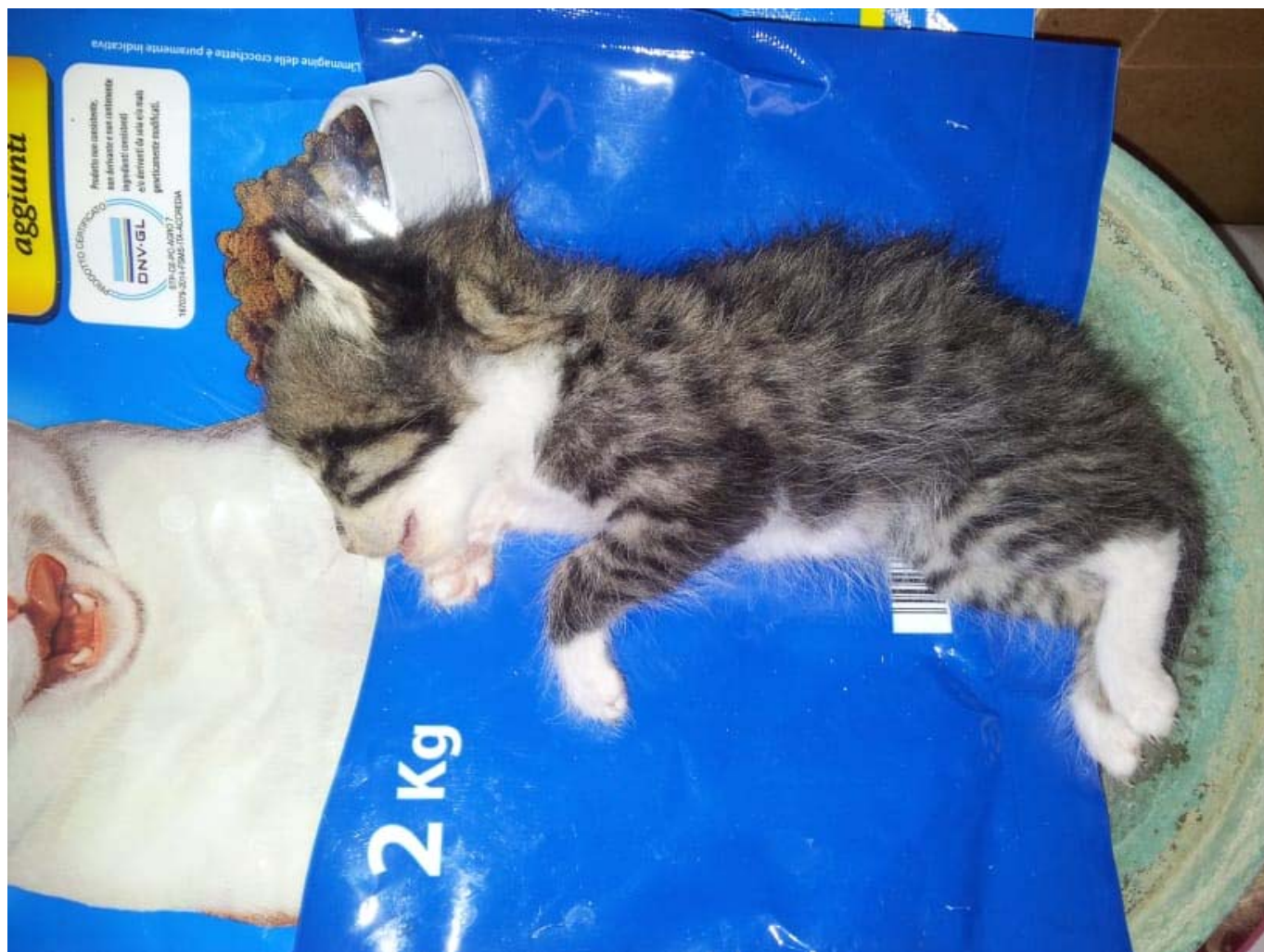
— WhatsApp Image 2019-06-05 at 22.25.21 (1).jpeg